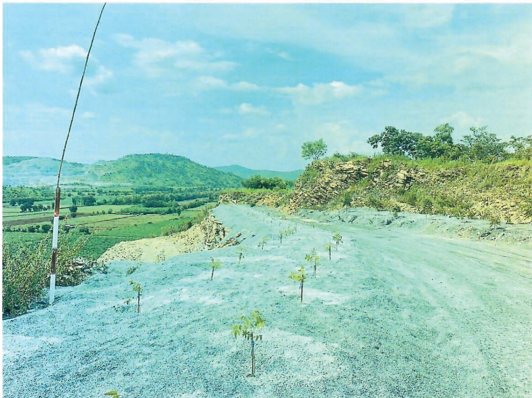
รูปที่ 3 และรูปที่ 4 เป็นการลงมือปลูกต้นไม้บริเวณพื้นที่ที่ได้เตรียมไว้ โดยปลูกต้นสะเดาจำนวน 100 ต้น 2 แถวแถวละ 50 ต้น