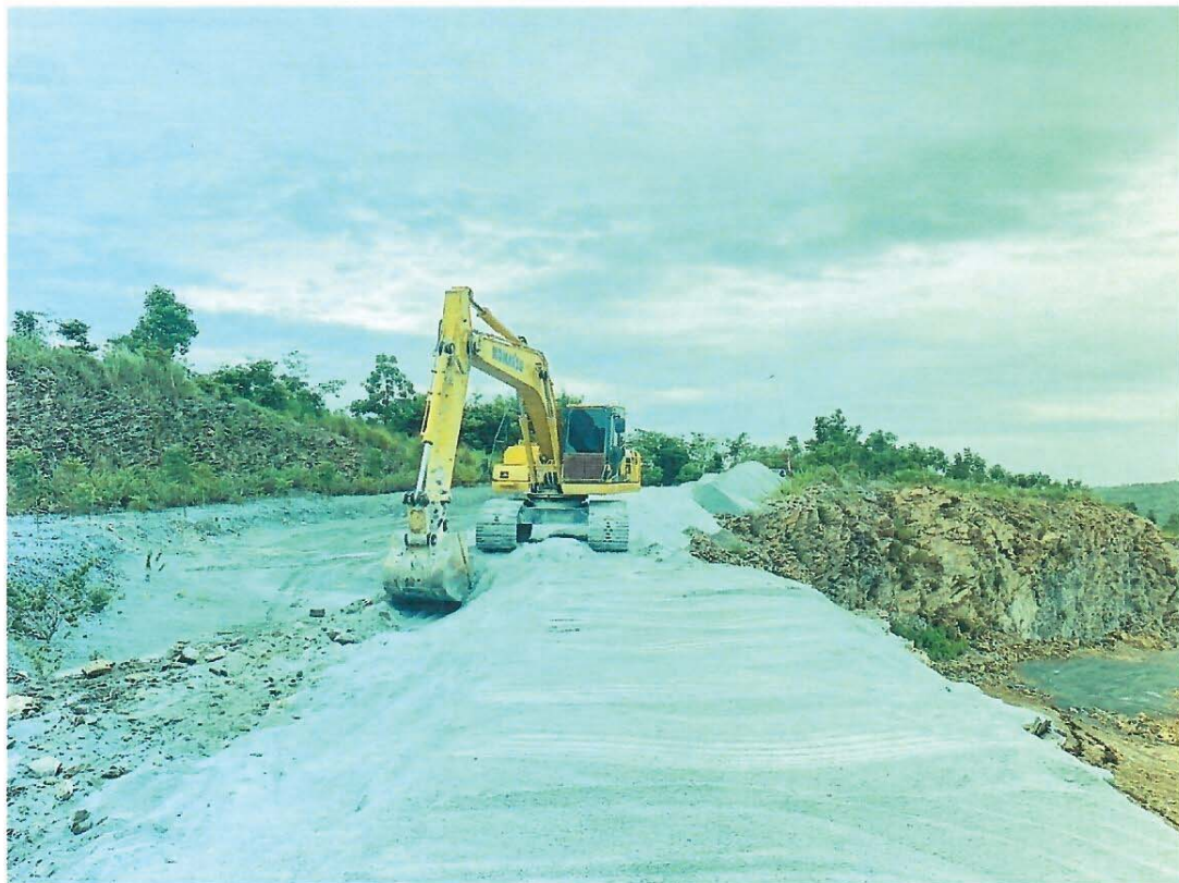
รูปที่ 1 และรูปที่ 2 เป็นการเตรียมพื้นที่ในการปลูกต้นไม้ โดยทำเป็นคันกั้นบริเวณหน้าเหมืองใน บริเวณเขตประทานบัตร